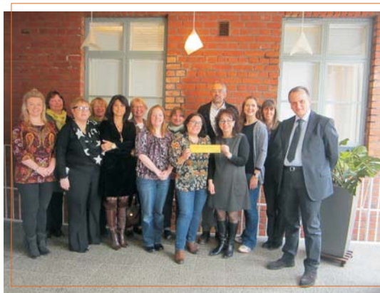
meeting in Helsinki, April 2013