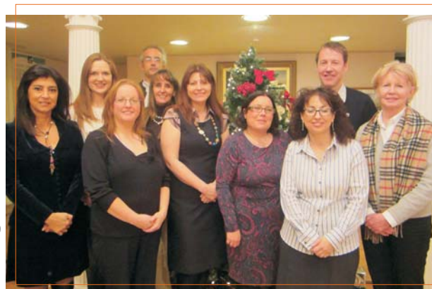
meeting in Lisburr, November 2012

L'impatto a lungo termine del progetto sarà dimostrato con l'integrazione del corso in altri college e agenzie di formazione professionale europee e, di conseguenza, con l'aumento del numero di persone con ID che accedono al mercato del lavoro.