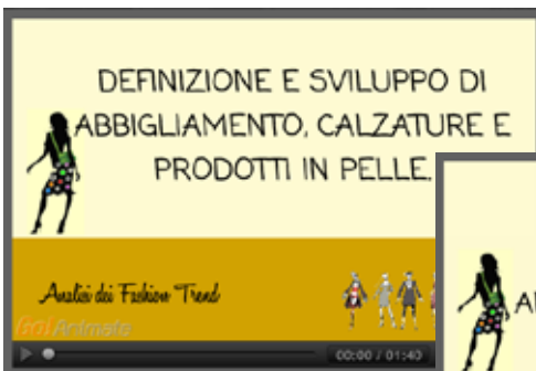
Analisi dei Fashion Trend

Sulla base del Dizionario delle Competenze sviluppato per la figura professionale del Designer di Moda, sono state realizzate diverse animazioni che mettono in scena alcune delle attività del processo di “Definizione e sviluppo del settore abbigliamento, calzature e prodotti in pelle” in cui l’utente può riconoscersi, favorendo così il percorso di apprendimento.