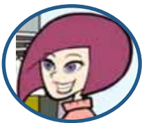
Anastasia: la Fashion Designer