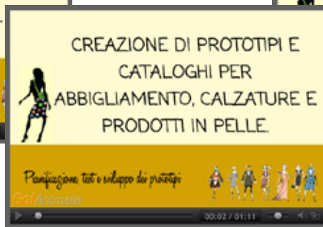
Pianificazione, test e sviluppo dei prototipi