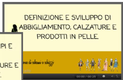
Creazione di schemi e schizzi