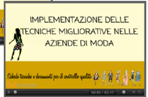
Schede tecniche e documenti per il controllo qualità